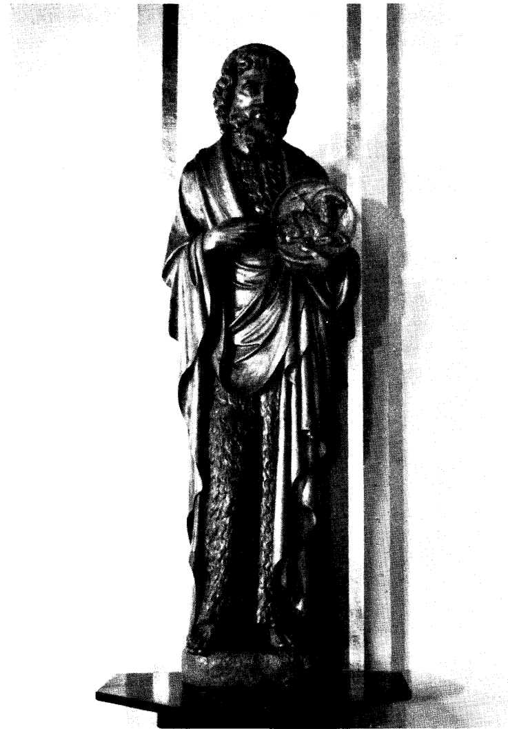
St. Johannes Baptist