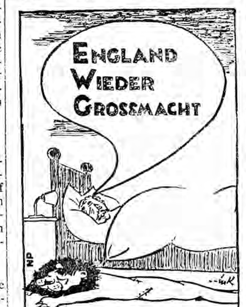
Macmillans Traum von der EWG

Absatzes zu ordnen, die Notwendigkeit für wohlhabende Staaten, ihre Märkte für die Erzeugnisse der Entwicklungsländer zu öffnen.