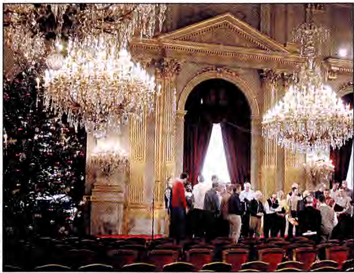
Vor dem Konzert musste sich der Chor erst einmal auf die ungewöhnliche Kulisse im Stadtschloss einstellen.

Von noch mehr Sangesfreude zeugte der Abgesang, das fröhliche und laute Schubidubidu anschließend bei der Heimfahrt nach einem Zwölfstundenausflug, aber das konnte die Königsfamilie wohl nur ahnen.